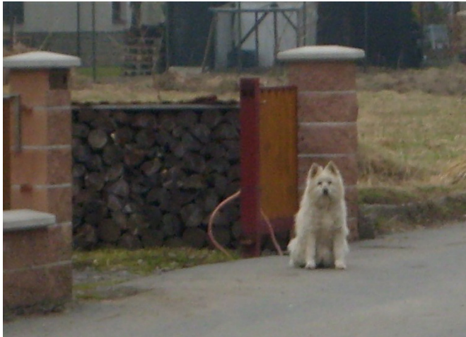
Nejenže obtěžuje a leze až do domu, ale i kálí na všech možných místech. Vzorek můžu zaslat. (zasláno občanem Bystřičky)

Ve zpravodaji č. 1/2008 byla řešena problematika volného pobíhání psů, znečišťování veřejného prostranství a legislativa k této problematice. Tato výzva směřována majitelům pejsků vydržela však jen krátce.