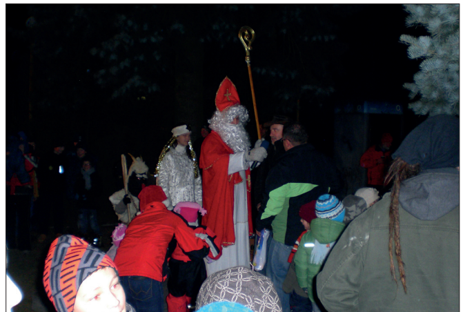
Mikulášská nadílka u obecního úřadu (3. 12. 2011)

Předprodej vstupenek bude zahájen 3. 1. 2012 na Obecním úřadu Bystřička. V předprodeji bude 120 ks vstupenek (bez rezervace). 10 ks. vstupenek bude možno zakoupit v restauraci „Na Nové“ před zahájením plesu. Deset hlavních cen bude slosovatelných na vstupenku, další ceny budou obsaženy v ruličkové tombole. Srdečně zvou pořadatelé.