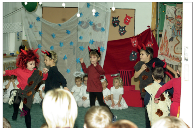
Mikuláš v MŠ Jeřabinka (7. 12. 2011)