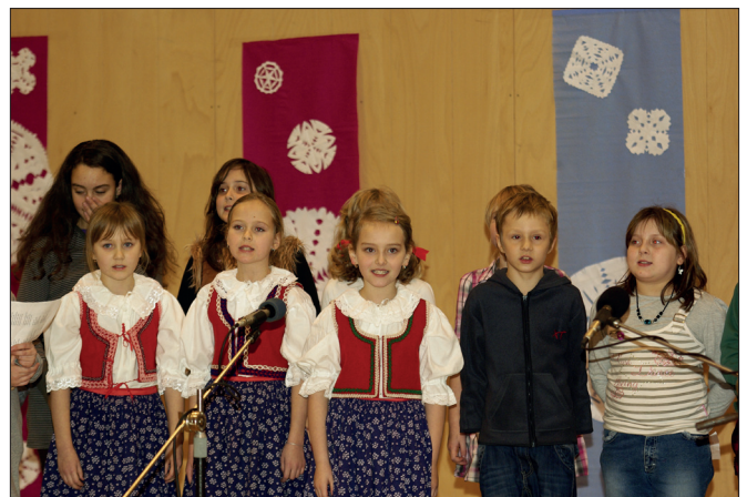
Vánoční slavnost ZŠ Růžďka (21. 12. 2011)